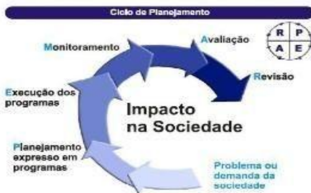
Figura 1: Ciclo de Planejamento

O Ciclo de Gestão do PPA é composto pelas etapas de elaboração, execução, monitoramento, avaliação e revisão dos Programas, como mostrado na Figura 1. Todo o processo é iniciado a partir da identificação de um problema ou demanda da sociedade.